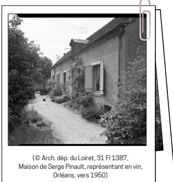
(© Arch. dép. du Loiret, 31 FI 1387, Maison de Serge Pinault, représentant en vin, Orléans, vers 1950)

Les Archives départementales vous proposent de participer à un atelier d'initiation à la recherche en deux séances, afin de vous aider à établir l'histoire d'une maison. Si vous souhaitez connaître l'évolution d'une maison loirétaine et le nom de ses anciens propriétaires, n'hésitez pas à vous inscrire !